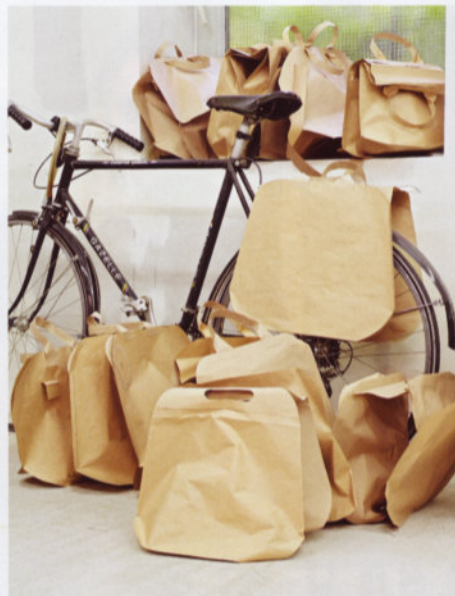
Sitzelemente der Serie „Bent“ aus perforiertem Aluminiumblech; Entwürfe für eine Fahrradtasche

Stefan Diez zeigt, dass sich junges deutsches Design mit klugen Lösungen auch auf internationaler Ebene durchsetzen kann